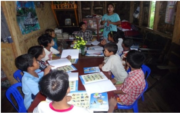
စစ်တွေမြို့၊ ဆတ်ရိုးကျစခန်းရှိဘဝတွက်တာကျွမ်းကျင်စရာသင်တန်း

တတ်မှု၊ HIV ပိုးကြောင့် ဖြစ်ပေါ်တတ်သော ရောဂါများ ကူးစက်ပျံ့နှံ့မှု၊ အပြုသဘောဆောင် တွေးခေါ်တတ်မှုစသည့် အကြောင်းအရာများအား သင်ကြားပို့ချခြင်း ဖြစ်ပါသည်။