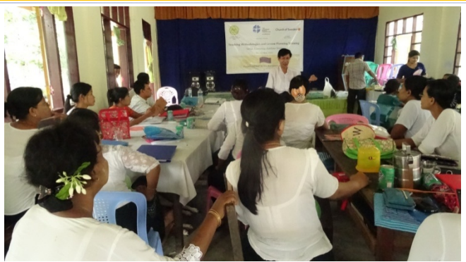
ရခိုင်ပြည်နယ်၊ စစ်တွေမြို့၊ ဆင်ကူးလမ်းရပ်ကွက်၊ အမှတ်(၆) အခြေခံပညာ အလယ်တန်းကျောင်းတွင် ပြုလုပ်နေသော သင်ကြားမှုနည်းစနစ်များနှင့်သင်ခန်းစာစီမံခန့်ခွဲမှုသင်တန်း

လူသရမ်ဂေါလ်ဖက်ဒရေးရှင်းမှ သုံးလတစ်ကြိမ် ထုတ်ဝေသောစာစောင် - ဥရောပသမဂ္ဂ ပညာရေးစီမံကိန်းမှ မြန်မာနိုင်ငံအတွက် ထောက်ပံ့ပေးသော ပညာရေးစီမံကိန်း