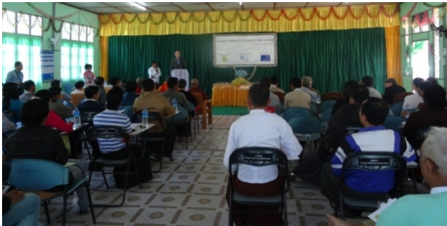
၂၀၁၅ခုနှစ်ဖေဖော်ဝါရီလ(၄)ရက်နေ့တွင်ကျင်းပသော ဥရောပသမဂ္ဂ(EU) ပညာရေးဆိုင်ရာအထောက်ပံ့ပေးခြင်းစီမံကိန်းဖွင့်ပွဲအခမ်းအနား

လူသရမ်ဂေါလ်ဖက်ဒီမိုကရေစီ မြန်မာအဖွဲ့သည် ရခိုင်ပြည်နယ် အတွင်း ဒေသဖွံ့ဖြိုးရေး လုပ်ငန်းများ ဆောင်ရွက်လျက်ရှိသော နိုင်ငံတကာလူမှုရေး အဖွဲ့အစည်းတစ်ခု ဖြစ်ပါသည်။ ၂၀၁၅ ခုနှစ်၊ ဖေဖော်ဝါရီလ(၄)ရက်နေ့တွင် ဥရောပသမဂ္ဂ၏ ရခိုင်