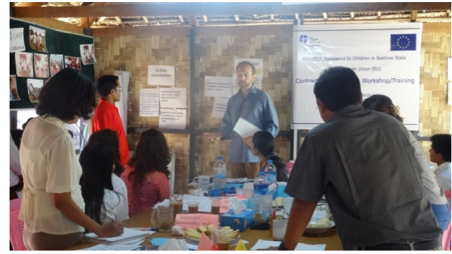
၂၀၁၅ခုနှစ်၊မတ်လ(၁၈)ရက်နေ့တွင် ကျင်းပသောအလုပ်ရုံဆွေးနွေးပွဲတွင် ကျသင့်ငွေအကြောင်းရှင်းပြနေသော LWF ဂျီနီဗာရုံးချုပ်၏ ကမ္ဘာလုံးဆိုင်ရာရံပုံငွေရှာဖွေရေးအရာရှိအားမြင်တွေ့ရစဉ်

ကျင့်သုံးရေး အလုပ်ရုံဆွေးနွေးပွဲအား ကျင်းပပြုလုပ်ခဲ့ ပါသည်။ အဆိုပါ အလုပ်ရုံဆွေးနွေးပွဲ၌ အဓိကအားဖြင့် စီမံကိန်းများ အကောင်အထည်ဖော်ရာတွင် အလှူရှင်အဖွဲ့အစည်း၏ စည်းမျဉ်းစည်းကမ်းအတိုင်း လိုက်နာကျင့်သုံးနိုင်ရေး၊ ကုန်ကျသင့်သော အသုံးစရိတ်များအတွက်သာ သုံးစွဲစေရေး၊ စီမံကိန်းရသုံးငွေများအား သင့်တင့်လျောက်ပတ်စွာ စီမံခန့်ခွဲစေရေး၊ မှန်ကန်သော အစီရင်ခံစာများ ရေးသားတင်သွင်းနိုင်ရေး၊ စီမံကိန်းဆိုင်ရာ အချက်အလက်ပါ စာရွက်စာ တမ်းများအား စနစ်တကျ သိမ်းဆည်းထားရှိရေး၊ အသုံးစရိတ်များအား စိစစ်နိုင်ရန် ကြိုတင်စီမံထားရှိရေး၊ ဥရောပသမဂ္ဂ၏ အထောက်အပံ့ပေးမှုဆိုင်ရာ လုပ်ထုံးလုပ်နည်းများအား နားလည်သိရှိရေးနှင့် ဥရောပသမဂ္ဂ အထောက်ပံ့ပေးမှုဆိုင်ရာ စာချုပ်ပါ အချက်အလက်များအား သိလိုလျှင် မေးမြန်းတတ်ရန်နှင့် သတင်းအချက်အလက်များ တောင်းခံတတ်စေရန် ရည်ရွယ်ကျင်းပခဲ့ခြင်း ဖြစ်ပါသည်။